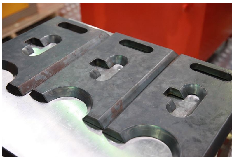
图 4：碳钢 80mm 切割效果